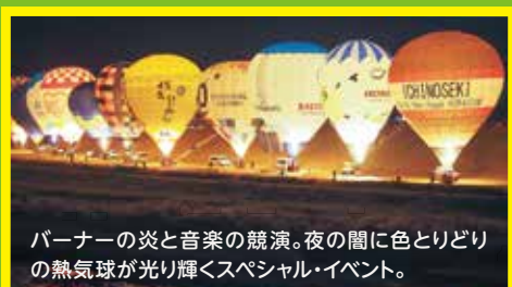
バーナーの炎と音楽の競演。夜の間に色とりどりの熱気球が光り輝くスペシャル・イベント。