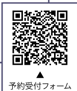
予約受付フォーム